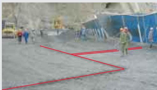
Installation du câble à fibres optiques au barrage RCC de Shimenzhi (R.P. de Chine)

Des gradients de température élevés permettent une détection des fuites plus précise que si les gradients étaient faibles. La société GTC a perfectionné le procédé de mesures de températures le