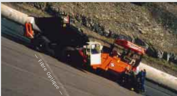
Installation d'un câble à fibres optiques chauffé

Les deux procédés d'investigation, par suivi de l'échauffement et par suivi du refroidissement, peuvent être modélisés numériquement pour différents paramètres des matériaux (capacité calorifique, conductivité thermique, porosité), pour différentes vitesses d'écoulement et pour différentes intensités de la source chauffante. Par comparaison dans le temps des tracés des températures mesurées avec les courbes calculées à partir de modèles numériques, il est possible de définir la vitesse de Darcy dans le voisinage de la sonde chauffante. La pénétration horizontale de la méthode HPM dépend de la durée d'échauffement, de l'intensité de la source chauffante et de la vitesse d'écoulement.